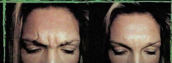
Čelo před aplikací