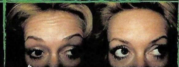
Čelo před aplikací